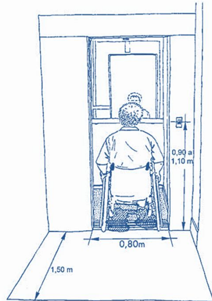
Rellano de embarque y cabina de ascensor