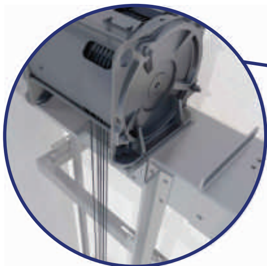
Detalle de máquina sobre bancada.